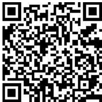
Kuva 2 QR-koodi Mustikkatassun seikkailut Seppo-peliin

Erityisenä mainintana QR-koodi Mustikkatassun seikkailut -peliin, joka toimii päiväkodin esittelynä ja varhaiskasvatuksen perehdyttäjänä lapsiperheille. Lisäksi video Mustikkatassun tiloista on saanut kiitosta monilta ulkopuolisilta tahoilta, jotka ovat halunneet tutustua tiloihin esim. ennen päiväkodissa vierailua.